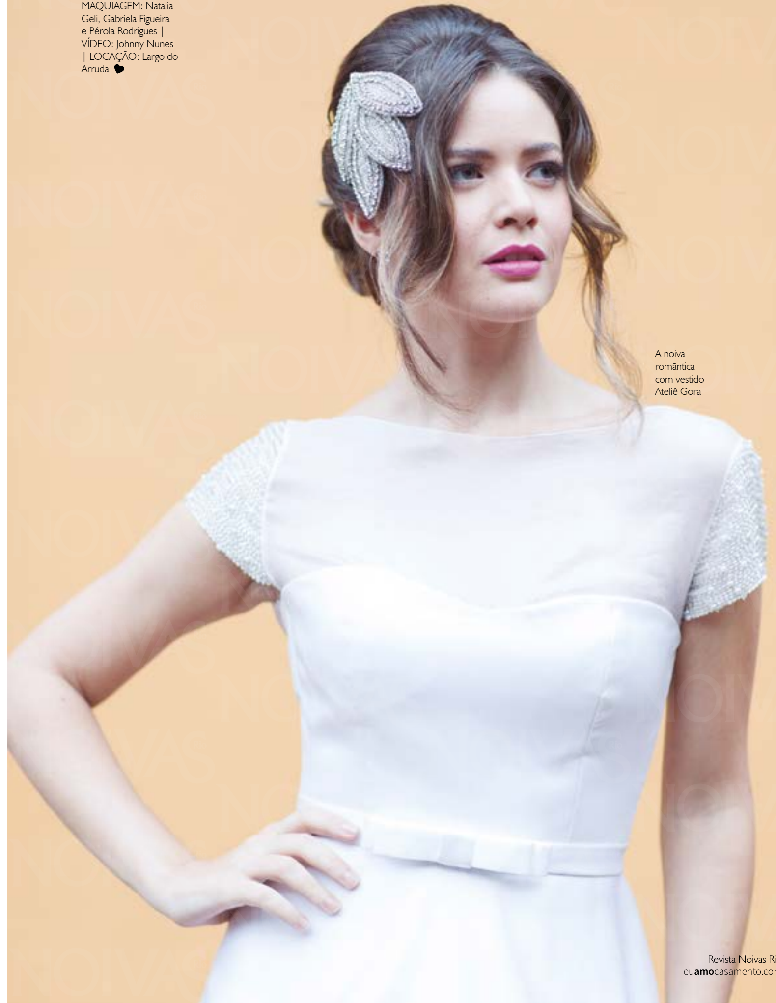
A noiva romântica com vestido Ateliê Gora

FOTOS: Georgetana Godinho | ASSISTENTE DE FOTOGRAFIA: Michelle Beff | ASSISTENTES DE CABELO E MAQUIAGEM: Natalia Geli, Gabriela Figueira e Pérola Rodrigues | VÍDEO: Johnny Nunes | LOCAÇÃO: Largo do Arruda ♥