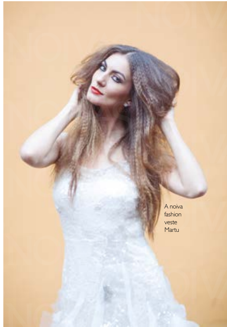
A noiva fashion veste Martu